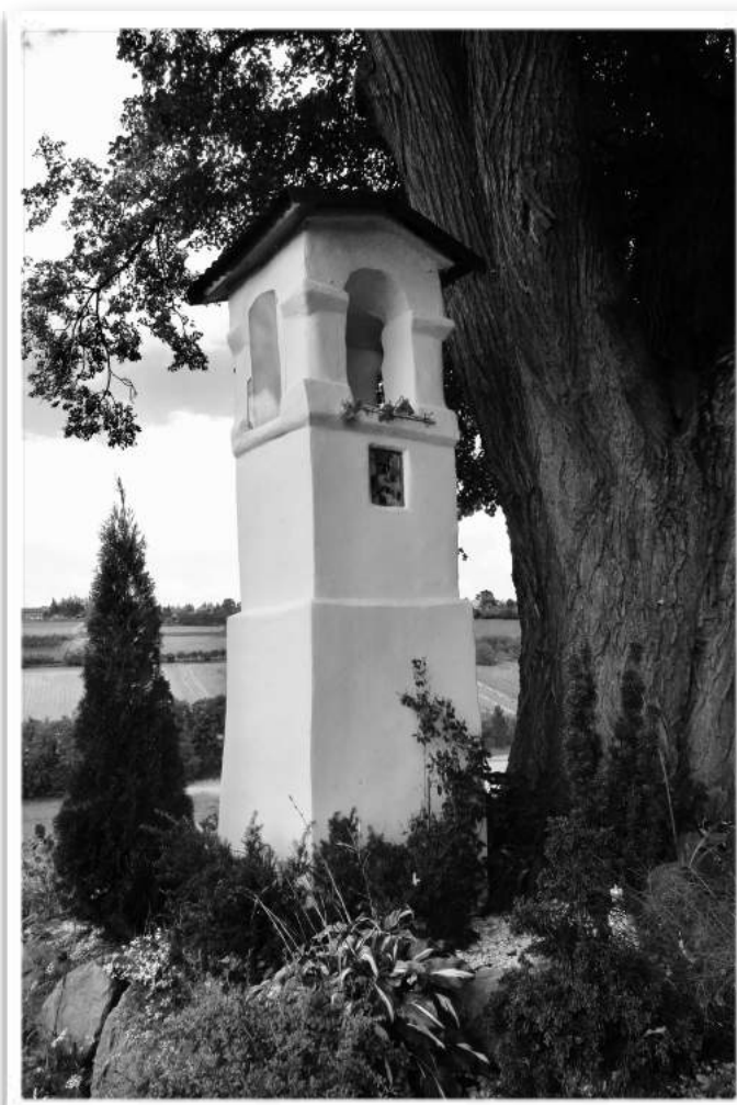
kapliczka do renowacji w Bojańczykach - gmina Raciechowice (PL)

projektu przyczyni się do zachowania przed zniszczeniem kapliczek oraz krzyży będących świadectwem religijności mieszkańców obszaru, będących ważnym dla nich elementem życia i na stałe wpisujących się w krajobraz dziedzictwa kulturowego czterech gmin, a nawet szerzej – całego pogranicza. Dla odwiedzających obiekty