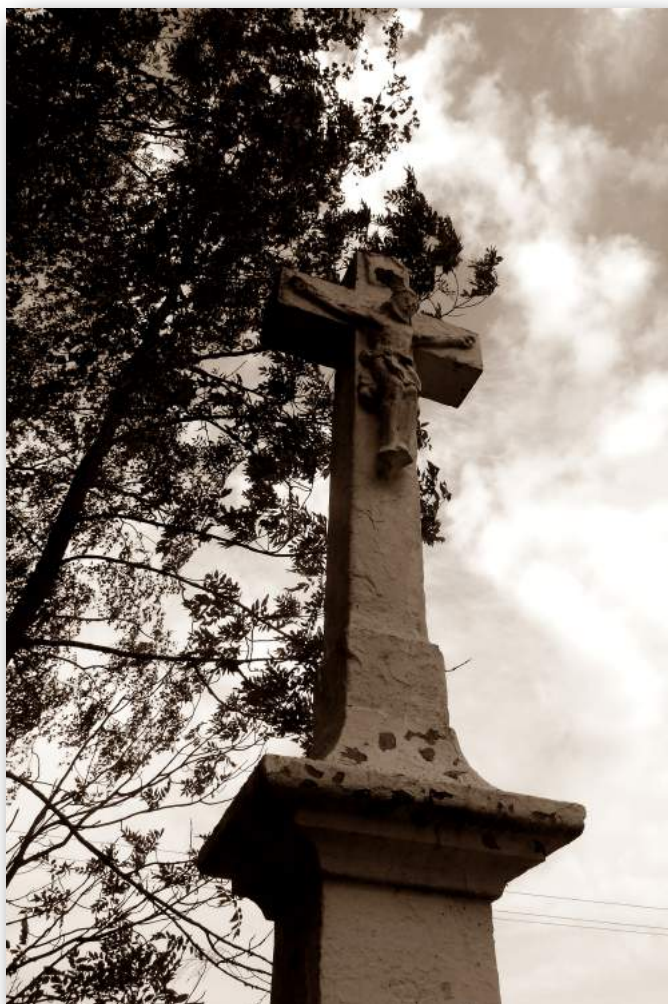
krzyż do renowacji w gminie Głodówka (SK)

Kapliczki i krzyże mówią nam wiele o ludziach, o historii i zwyczajach panujących na pograniczu. Należy o nich pamiętać bowiem na stałe wpisały się w ten krajobraz. Są tu można powiedzieć „od zawsze”. Były świadectwem wielu lokalnych tragedii, pełniły też rolę "drogowskazów". Dzisiaj są miejscem kultu, nabożeństw, wyrazem potrzeby modlitwy.